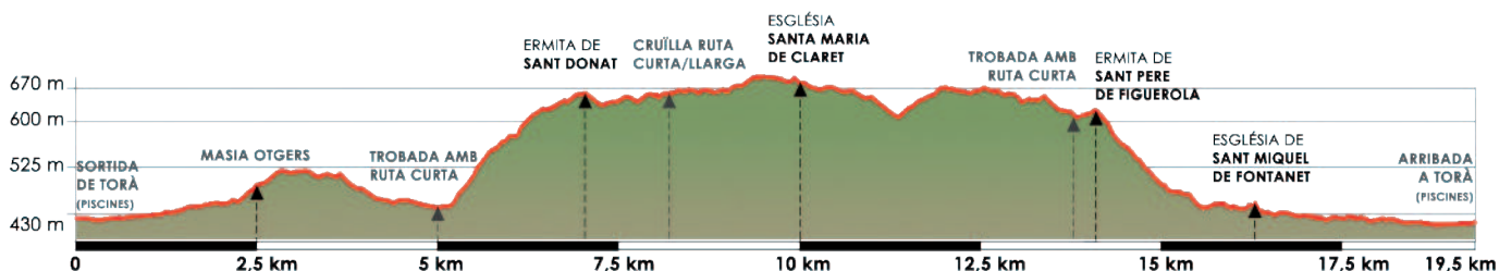
PERFIL DE LA RUTA LLARGA. RUTA DE LES 4 ERMITES. GR-170